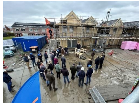
Figuur 1-1: TLC woningen in aanbouw Wierden en Borgen (bron: Wierden en Borgen)

Wierden en Borgen is terughoudend met de verkoop van woningen, omdat de vraag naar woningen toeneemt. De woningstichting verkoopt woningen alleen als deze onderdeel zijn van een blok waar in het verleden de meeste woningen al zijn verkocht. Van verkoop van woningen in kleine kernen is wel sprake. De woningstichting hanteert deze maatwerkstrategie om betaalbare koopwoningen aan te bieden aan koopstarters die vaak weinig kansen hebben in deze kernen. Daarnaast heeft Wierden en Borgen aan het einde van de visitatieperiode (december 2023) 176 woningen verkocht aan collega corporatie Wold en Waard. Hiermee is Wierden en Borgen niet meer actief in de gemeente Westerkwartier.