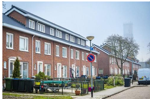
Figuur 1-2: renovatie en verduurzaming 49 woningen Molukse Wijk in Hoogkerk

Wierden en Borgen heeft belangrijke stappen gezet in het inhalen van achterstallig onderhoud in een deel van haar bezit. Dit geldt vooral voor bezit wat in de vorige visitatieperiode is overgenomen van een collega-corporatie. Huurders hadden terecht klachten over de woonkwaliteit, zoals schimmelvorming.