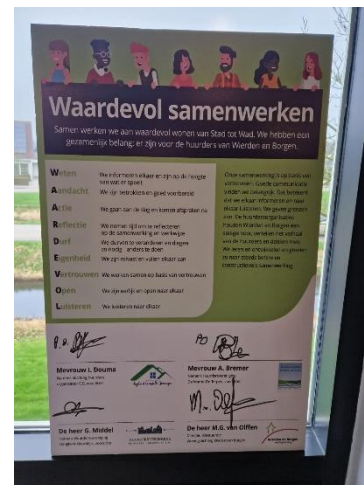
Figuur 2-1: Samenwerkingsafspraken huurdersorganisaties en Wierden en Borgen

De huurders zijn de belangrijkste belanghebbende voor Wierden en Borgen. De huurders worden vertegenwoordigd door drie huurdersorganisaties verspreid over het werkgebied. Wierden en Borgen betreft de drie huurdersorganisaties gezamenlijk bij beleidskeuzes die ze maken, over ontwikkelingen die er spelen en over de kwaliteit van de dienstverlening. Daarnaast hebben de huurdersorganisaties een periodiek overleg over zaken die spelen in hun eigen werkgebied, zoals versterkingsprojecten, verduurzamingsprojecten en leefbaarheid. Ook zijn de huurdersorganisaties onderdeel van het tripartite overleg met de betreffende gemeente voor het opstellen van de prestatieafspraken. Noemenswaardig is verder dat de drie huurdersorganisaties onderling ook veel met elkaar optrekken; bijvoorbeeld in de afstemming van beleidsvoorstellen en -adviezen. Op deze wijze is zowel de lokale verankering op dit vlak geborgd, maar wordt tegelijkertijd het werk voor de vertegenwoordigers waar mogelijk ook centraal opgepakt en worden kwaliteiten effectief ingezet.