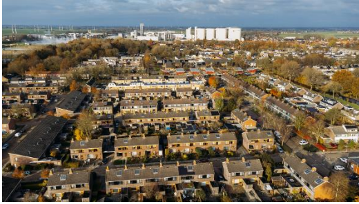
Figuur 1-3: renovatie en verduurzaming 79 woningen Schildersbuurt in Hoogkerk

De overige samenwerkingspartners, met name de aannemersbedrijven, zien dat Wierden en Borgen veel investeringen doet om de woningen op te knappen en te verbeteren. Daarbij gaat de corporatie voor het leveren van kwaliteit. NCG geeft aan dat Wierden en Borgen ook goed zoekt naar de mogelijkheden om de versterking en verduurzaming te koppelen. Een collega-corporatie benoemt daarbij dat ze elkaar versterken in de verduurzamingsopgave. Een ander punt dat wordt benoemd is dat Wierden en Borgen een voortrekkende rol inneemt om initiatieven te ontplooiën die bijdragen aan het versnellen van de verduurzaming, het verbeteren van het woongedrag onder huurders en om te ontdekken wat mogelijk is met klimaat adaptief bouwen.