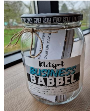
Figuur 4-1: Kletsplot kantine Wierden en Borgen

Wierden en Borgen had in de vorige visitatieperiode te maken met een relatief hoog vertrek van personeel. Bij een organisatie die gericht is op beheer was te weinig uitdaging en bezieling. Mede door de grote versterkingsopgave is er een gezamenlijke opgave gekomen en door het nieuwe management is een aanpak gekozen, die medewerkers aanspreekt. Wierden en Borgen heeft actief personeel geworven op meerdere niveaus in de organisatie om een nieuw team te vormen. Dat team bestaat uit een mix van personeel dat er al was en nieuwe mensen. De visitatiecommissie ziet dat er kwalitatief hoogwaardige medewerkers zijn aangetrokken die enthousiast aan de slag zijn met gevoel voor de opgaven en vraagstukken. Daarbij is er veel aandacht voor het samenwerken aan een nieuwe werkwijze en identiteit. En nu die identiteit beter is gevormd, helpt dit weer bij het werven van medewerkers om bij deze leuke organisatie te komen werken. De organisatie werkt met het Rendement van Geluk programma om het werkplezier te vergroten en de resultaten ervan te meten. Zo zijn er een 'kletsplot' en een 'doorgeefmok' om elkaar beter te leren kennen, is er een zeepkist om je als medewerker uit te spreken, en is er Jong Wonen om met andere Noordelijke corporaties als jonge medewerkers intervisie te krijgen. De visitatiecommissie hoorde veel waardering voor deze initiatieven om het werkgeluk te vergroten.